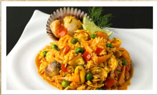
葡萄牙海鮮飯 Arroz de Marisco