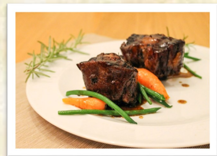
安達魯西亞 牛尾 Andalusian oxtail