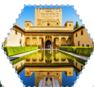
阿爾罕布宮 Alhambra Palace