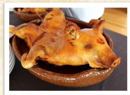
斯高維亞 烤乳豬 Suckling Pig