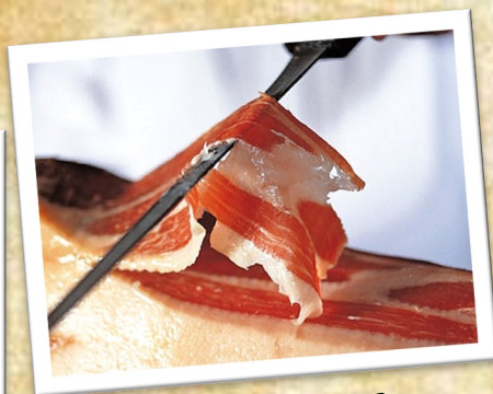
伊比利亞火腿 Jamón ibérico