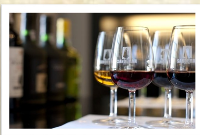
砵酒 Port Wine