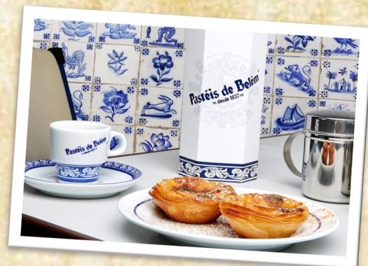
貝倫葡式蛋撻 Pastéis de Belém