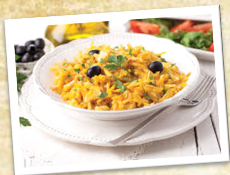
薯絲馬介休 Bacalhau à Brás