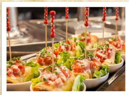
塔帕斯 小吃 Tapas