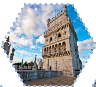
里斯本貝倫塔 Belem Tower