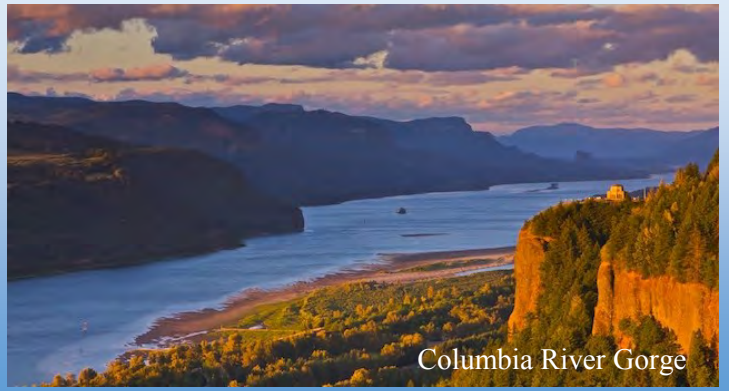
Columbia River Gorge